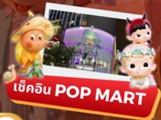
เช็किन POP MART