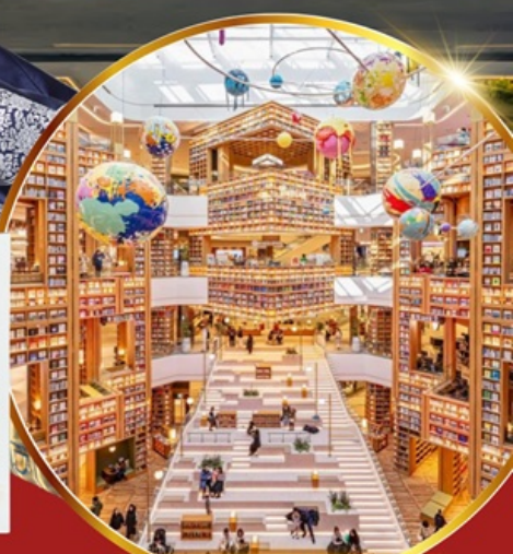
ห้องสมุด สตาร์พลาซ่า ซูวอน

เชคอินห้องสมุดสุดอลังการ ชมศิลปะดิจิทัลสุดล้ำ บนจอ LED เสมือนจริงขนาดยักษ์ หมู่บ้านเกาหลีโบราณทุกซอก อันอก อิสระซ็อบบี้ง 2 ย่านดัง ซองซู เมียงดง ซ็อบบี้งปลอดภาษี Lotte Duty Free