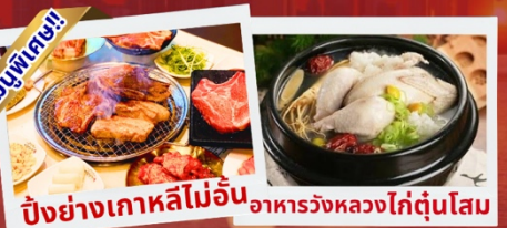
ปิ้งย่างเกาหลีไม่อื่น อาหารวังหลวงไก่ตุ๋นโสม