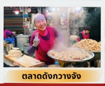
ตลาดดังกวางจ้ง