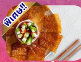
เปิดปักษ์ถึง