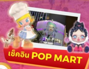
เช็กอิน POP MART