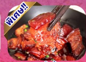
หมูสามชั้นน้ำแดง

พักโรงแรม 4 ดาว ★★★★★ ฟรี ประกันอุบัติเหตุ บริการ อาหารท้องถิ่น