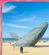
ประติมากรรม "วาฬผู้โดดเดี่ยว"