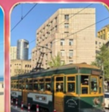
บั้งรถรางไฟฟ้าชมเมือง