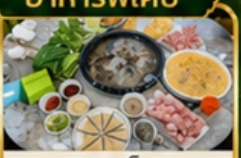
ชาชูเห็ด