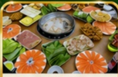
ชาชูแชลมอน