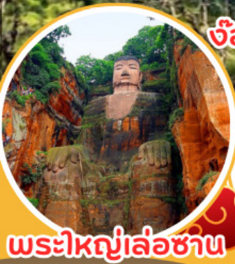
พระใหญ่เล่อซาน