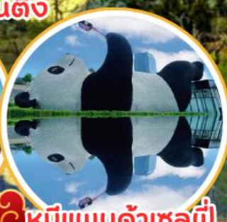
หมีแพนด้าเซลมี