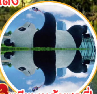
หมีแพนด้าเซลฟี่