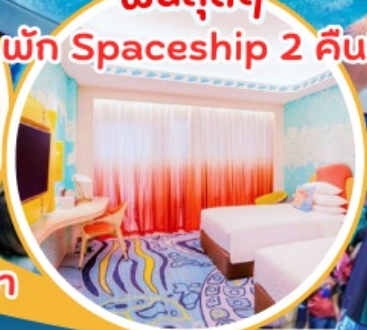
ฟินสุดๆ พัก Spaceship 2 คืน!!