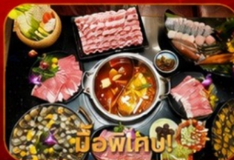
บุฟเฟ่ต์ชาบูสโล่ฮ่องกง