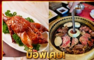
บิวเฟต์! เปิดอย่างฮ่องกง บิวเฟต์ปิ้งย่างเกาหลี