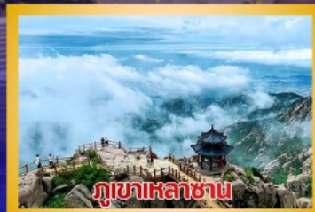
ภูเขาหล่าซาน