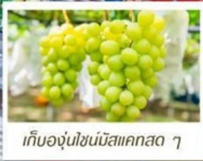
เก็บองุ่นไซน์มิสแคตสด ๆ

🇯🇵 เที่ยวเกาะ - โอซาก้า (รวมบัตรเข้าสวนสนุก USJ)