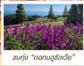
ชมทุ่ง "ดอกบลูซิลเวีย"