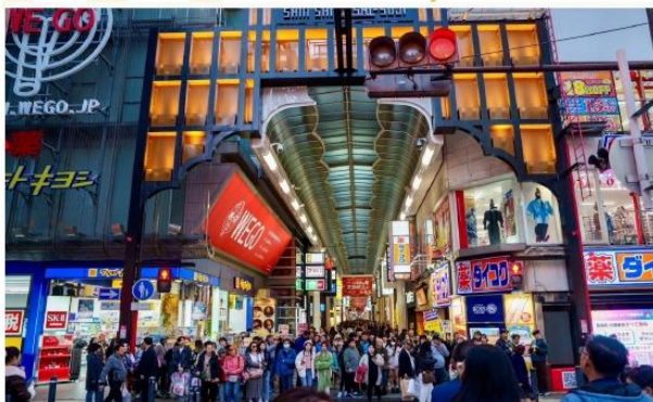
SHOPPING AT SHINSAIBASHI