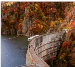
เขื่อนโฮเซเดียว