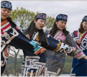
พืพิรภันท์ไอนุ UPOPOY