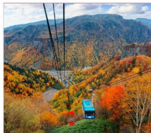
นั่งกระเช้าคุโรดากะ