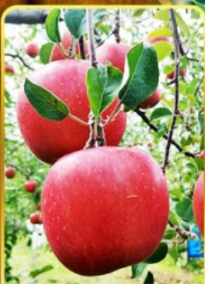
เก็บแอปเปิ้ล