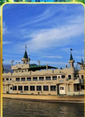
ล่องเรือทะเลสาบโทยะ