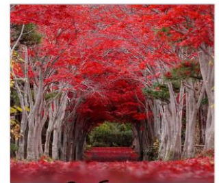
ชิราโอะกะ (อโม่ทึบเมเปิ้ล)