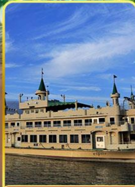
ล่องเรือทะเลสาบโทยะ