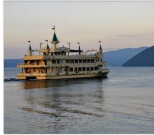
ล่องเรือทะเลสามโทยะ