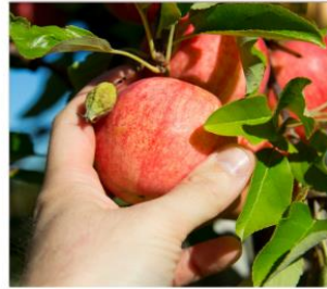
เก็บแอมเปิ้ล