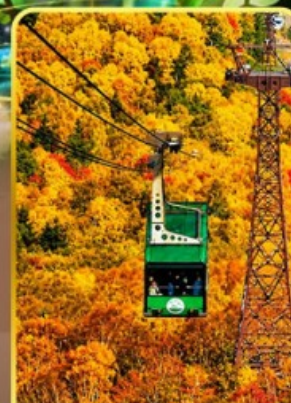
กระเช้าคุโรดากะ