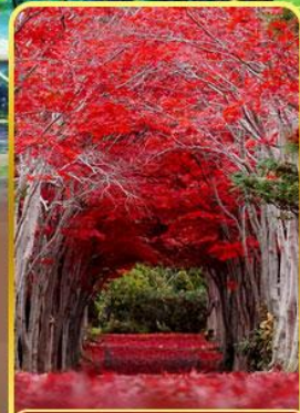
สวนอิราโอกะ