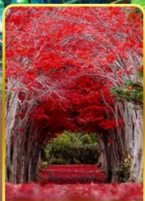
สวนอิราโอกะ