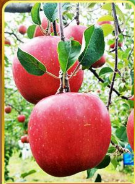
เก็บแอปเปิล