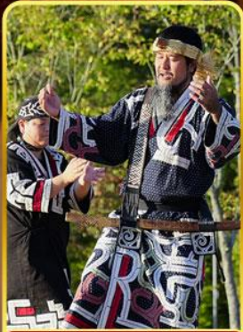
พิพิธภัณฑ์โอนู