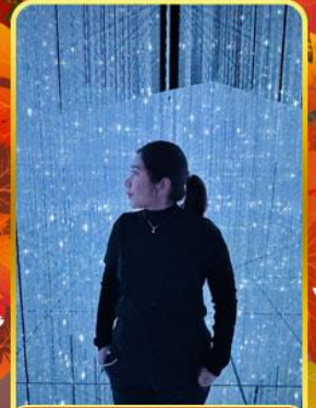
ทีมแลบโตเกียว