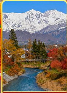
โออิตะพาร์ค