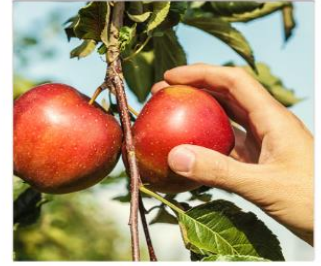
กิจกรรมเก็บแอปเปิ้ล