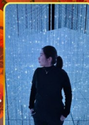
ทีมแอปโตเกียว