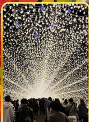
นาบะนะโนะชาคาะ