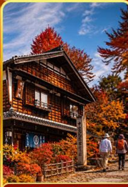
หมู่บ้านมาโกเมะจุกุ