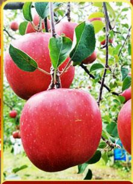
กิจกรรมเก็บแอปเปิ้ล