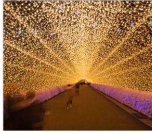
นาบะนะโนะซาโตะ