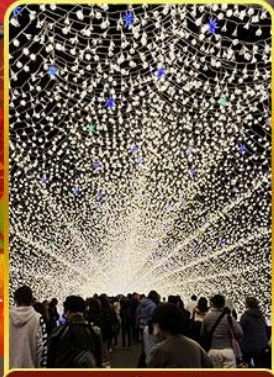
นาบะนะโนะซาโตะ