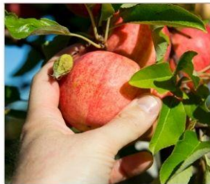
เก็นแอมเบ็ค