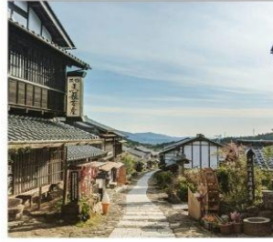
มาโกเมะจุกุ