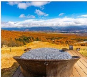
ดิโยซาโตะเทอเรส