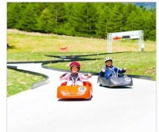
กิจกรรมขับโกคาร์ท