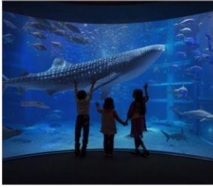
พิพิธภัณฑ์สัตว์น้ำไคยูดัง