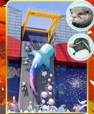
พิพิธภัณฑ์โคยูกัง

ออนเซ็น 2 คับ มน.กระเป๋า 23 กก.X2 8Days 5Night