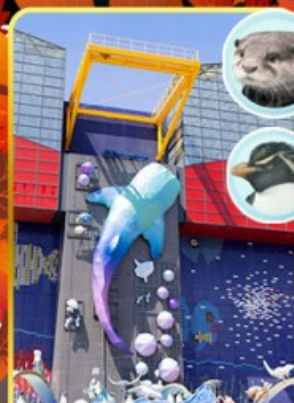
พิพิธภัณฑ์โตเกียวคัง

ออนเซ็น 2 คั้น นน.กระเป๋า 23 กก.X2 8Days 5Night