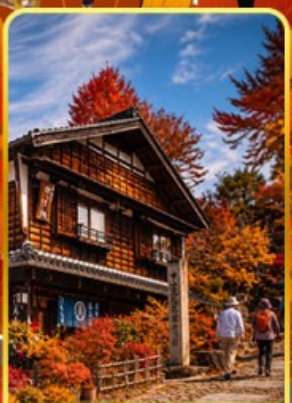
หมู่บ้านมาโกเมะจุกุ