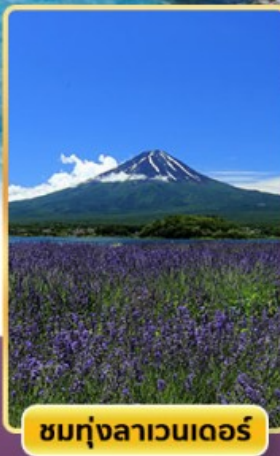
ชมทุ่งลาเวนเดอร์