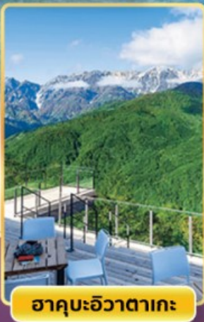
ฮาคุบะฮิวาตากะ