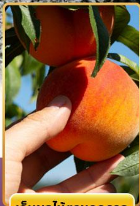
เก็บผลไม้ตามฤดูกาล