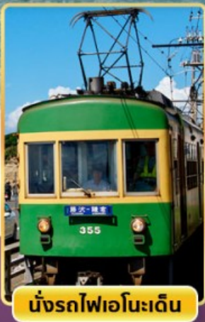
นั่งรถไฟเอโนะเด็ง