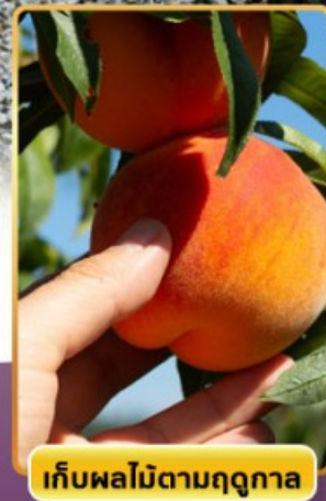
เก็บผลไม้ตามฤดูกาล