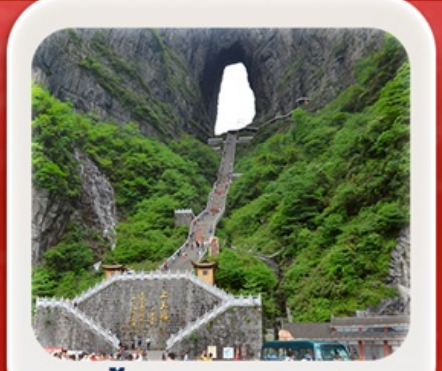
“กำประตูลิ่วหวง”