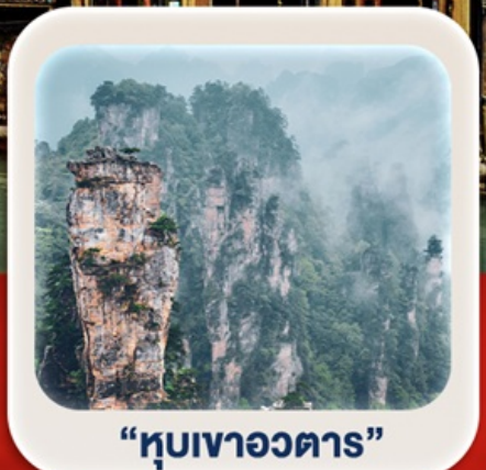
“หุบเขาอวตาร”

นั่งกระเช้าชมภูเขาเทียนเหมินซาน • กำประตูลิ่วหวง • ตึกมหัศจรรย์ 72 ชั้น เมืองโบราณเฟิ่งหวง (ล่องเรือ) + เมืองโบราณฟูหรงเจิน **พักติดเมืองโบราณ 2 คืน** ภูเขาเทียนจื่อซาน • หุบเขาอวตาร • สะพานแก้ว+VR4D • ชมโชว์จิ้งจอกขาว