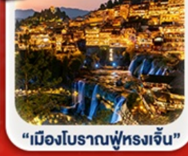
“เมืองโบราณฟูหรงเจิน”