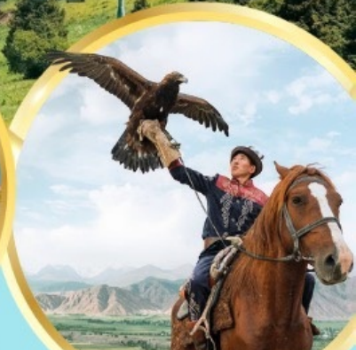
ชมโซว์นกอินทรี