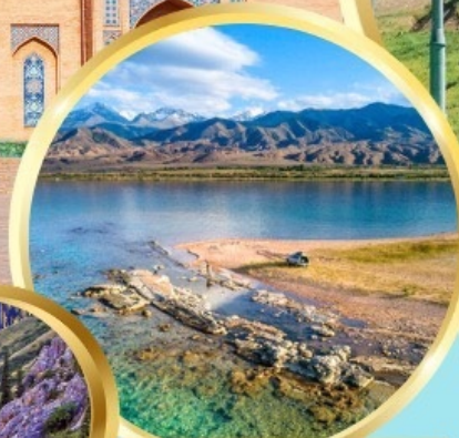
ล่องเรือทะเลสาบอิสซิค