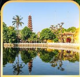
วัดเงินทิวก