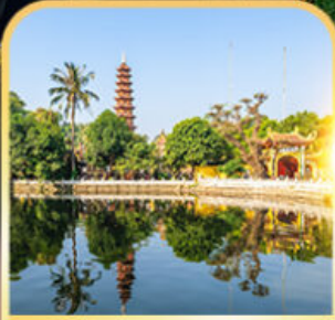
วัดเงินทิวก