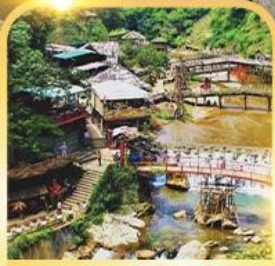
หมู่บ้านก๊อตก๊อต