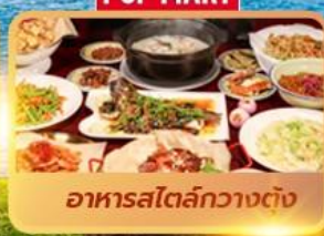
อาหารสตรีทกวางตุ้ง