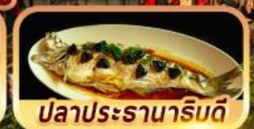
ปลาประรานาริมดี