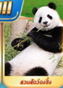
สวนสัตว์ฉงชิ่ง