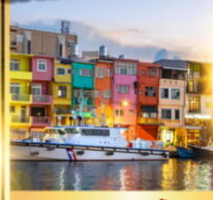
ท่าเรือประมงเจี๋ยปิง