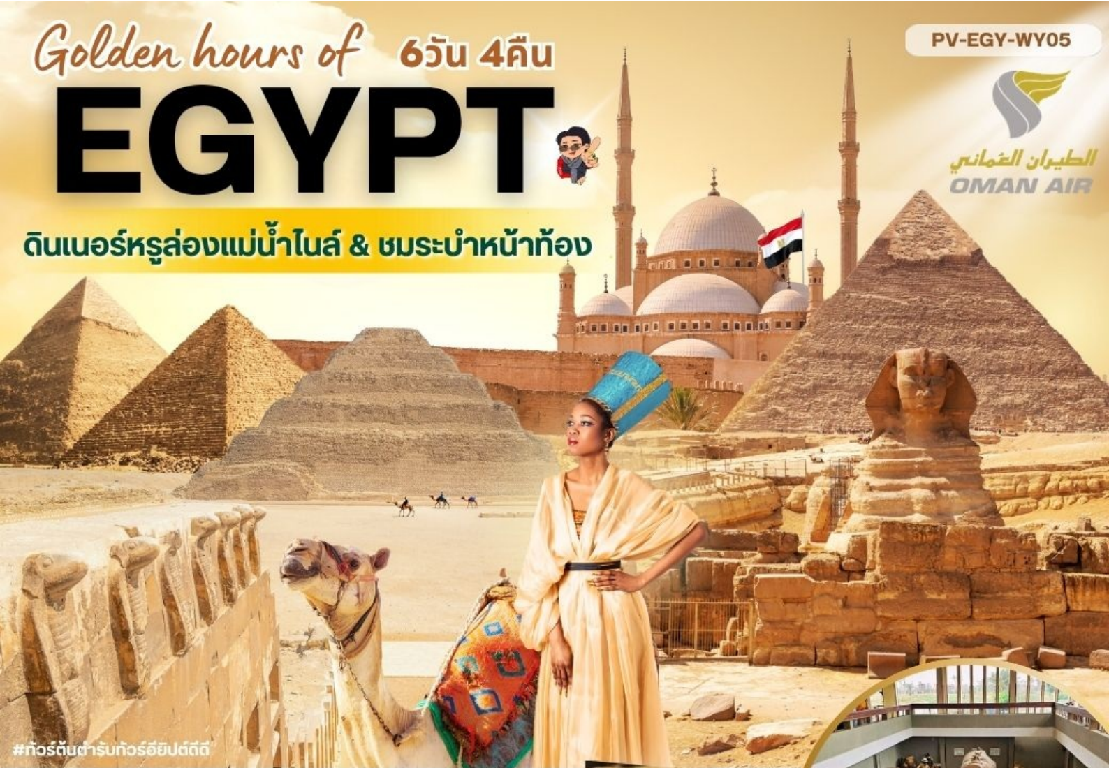
#ทัวร์ต้นตำรับทัวร์อียิปต์ดี