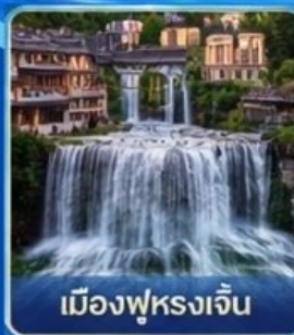
เมืองฟูรงเจิน