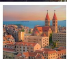
โบสถ์ ST. EMIL