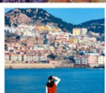
หาดซาจื่อฮั่ว