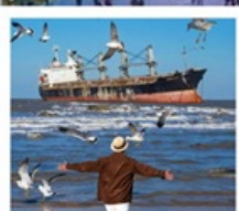
เรือบลูวิส