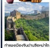
กำแพงเมืองจีนด่านซือหม่าโต