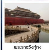
พระราชวังกุ๊กง