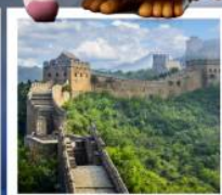
กำแพงเมืองจีนด่านซือหม่าไท่

เมืองโบราณกุ่เป่ย์สู่ยจิน / กำแพงเมืองจีนด่านซือหม่าไท่ (รวมค่ากระเช้าขึ้น-ลง) / ชมวิวกำแพงเมืองจีนและเมืองโบราณ ยูนิเวอร์แซลปักกิ่ง (รวมค่าบัตรเข้า) / จัตุรัสเทียนอันเหมิน / พระราชวังโบราณกรุง / หอบูชาเทียนถาน คาเฟ่กาแฟบ้านน้ำตาล (TANG FANG CAFE) / พระราชวังฤดูร้อนอวิ๋เหอหยวน / ย่านชานหลี่ถุน (POP MART) / ถนนคนเดินไท่กู่หลี่