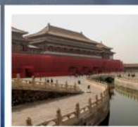
พระราชวังกรุง