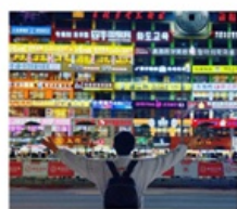
กำแพงมหาวิทยาลัยเหยียนเปียน