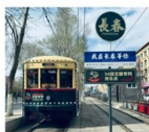
นั้รกรางดางซุน