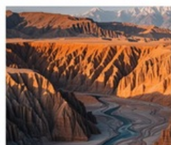
แกรนด์แคนยอนตู้ซานจื่อ