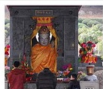
ไถ่ฮ่องกง