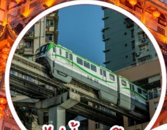
รถไฟฟ้า-ลูตีก Liziba Station