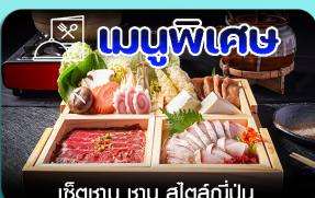
เช็ตซาบู ซาบู สีสต์ญี่ปุ่น