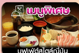
เมนูพิเศษ บุฟเฟ่ต์สไตล์ญี่ปุ่น

ซึบโปโร-ชมทุ่งดอกลาเวนเดอร์-โทมิตะฟาร์ม-ชิชิไซโนะโอกะ-น้ำตกชิราอิเกะ-บ่อน้ำสีฟ้า-อีสระะซ็อบบิงเต็มวัน-ฟักออนเซน