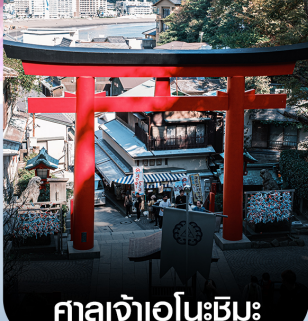
ศาลเจ้าอินะชิมะ