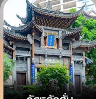
วัดหลิวอัน