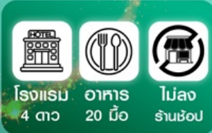
โรงแรม 4 ดาว