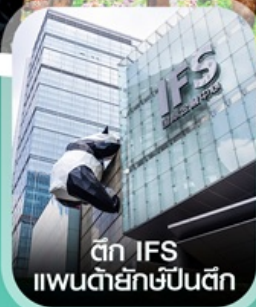
ตึก IFS แพนด้ายักษ์ป็นตึก