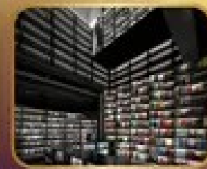
ชมร้านหนังสือ