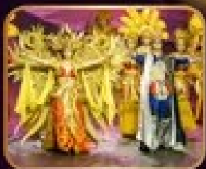
ชมชุดออกโชว์ระบำการตา