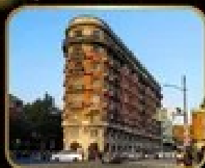
ถ่ายรูปจุดเช็คอิน WUKANG MANSION