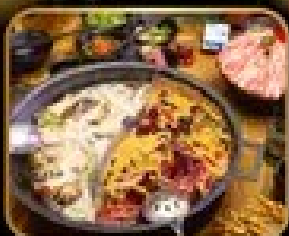
อาหาร มณฑลเจียงไห่ สุี้ หม้อไฟสไตล์จีน