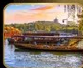
ล่องเรือ ทะเลสาบซีหู