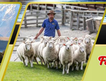
วอลเตอร์พีดฟาร์ม