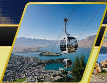
นั่งกระเช้าคอนโดล่า