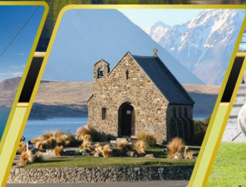
ทะเลสาบเทคาโป