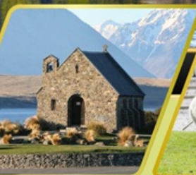
ทะเลสาบเทคาโป