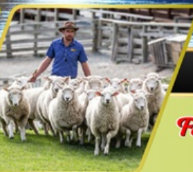
วอลเตอร์พีดฟาร์ม