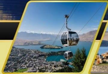
นั่งกระเช้ากอนโดล่า