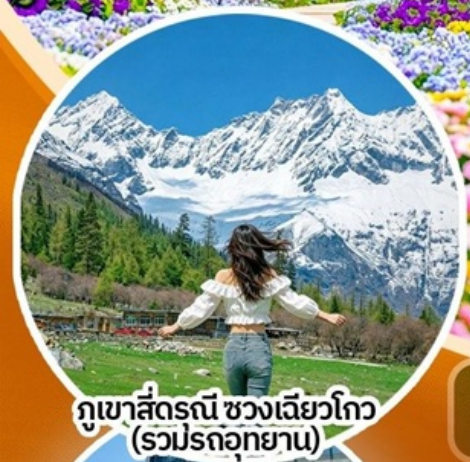
ภูเขาสี่ดรุณี ช่วงเลียวโกว (รวมปรดอุทยาน)