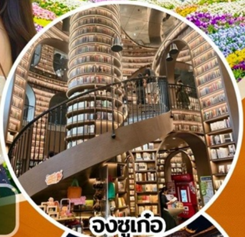
จงซูเก๋อ