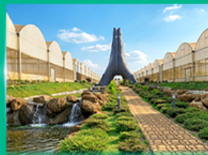
Agro Vege Farm