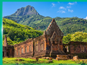
ปราสาทหินวัดพู