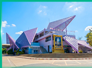
ด่านพรมแดนช่องเม็ก