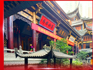
วอพรวัดหลว้อฉิน ฉงซิ่ง