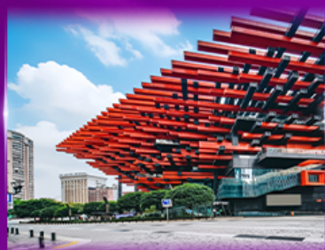
แลนด์มาร์กจิ่ง ตึกตะเกียบ