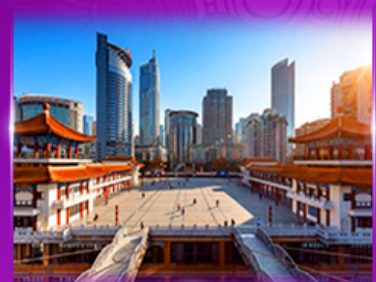
เข็ควิน ตึกโค่วซิงโห