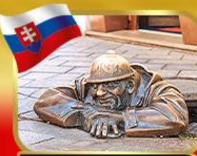
เข็คอินคู้คูมิลเมืองบาติสลาวา