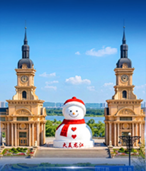
ตึกตาสหะฮักฮิ ฮาร์ฮิน