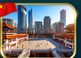
เขาคอนตึ๊งไคว่ซังโหล