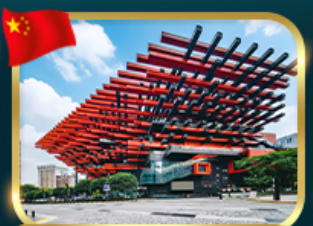
แลนด์มาร์กจั๊ว ตึกตะเกียบ