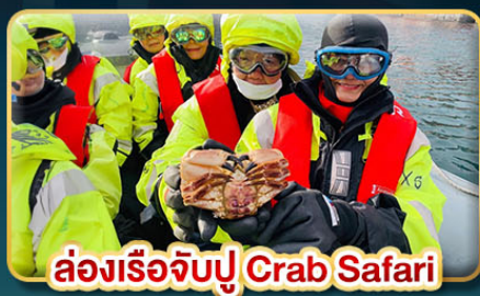
ล่องเรือจับปู Crab Safari

เยือนเมืองหลวงแห่งแสงเหนือ สัมผัสความสวยงามของนอร์เวย์ที่แท้จริง