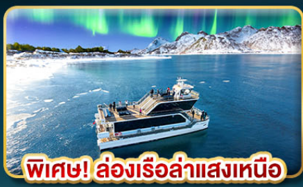
พิเศษ! ล่องเรือล่าแสงเหนือ