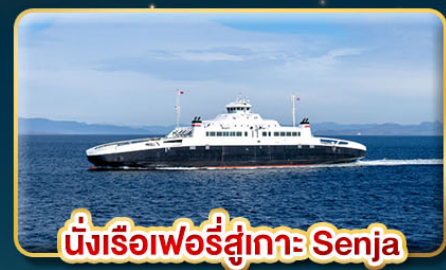
นั่งเรือเฟอร์รี่สู่เกาะ Senja