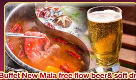
*Buffet New Mala free flow beer & soft drink