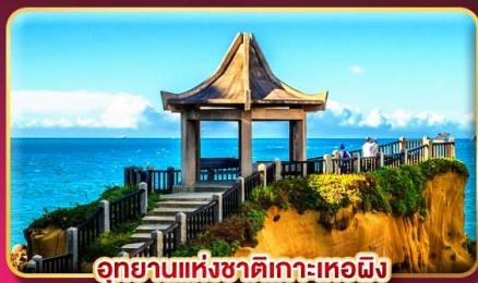
อุทยานแห่งชาติเกาะเหอผิง

ชมพลุข้ามปี ฉลองเทศกาลปีใหม่ 2027 แช่น้ำแร่ส่วนตัวในห้องพัก