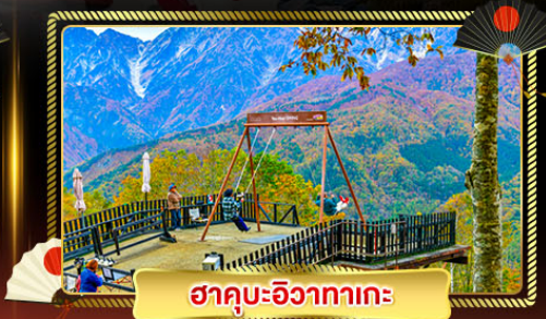
ฮาคูะอิซากาเตะ