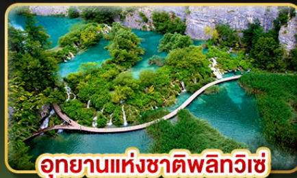
อุทยานแห่งชาติพลิตวิเช่