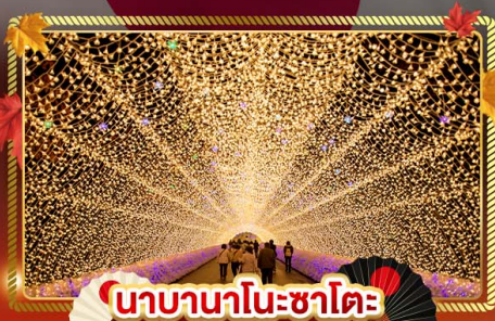
นาคานาโนะซาโตะ

"ชมความงามของฤดูใบไม้เปลี่ยนแล้ว" เที่ยวครบจบทุกไฮไลท์ โอซาก้า-โตเกียว พิเศษ!! บินแอร์แบบ FULL SERVICE